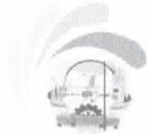
TABELA DE VENCIMENTOS - ANEXO II