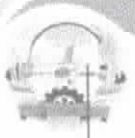
TABELA DE VENCIMENTOS - ANEXO II